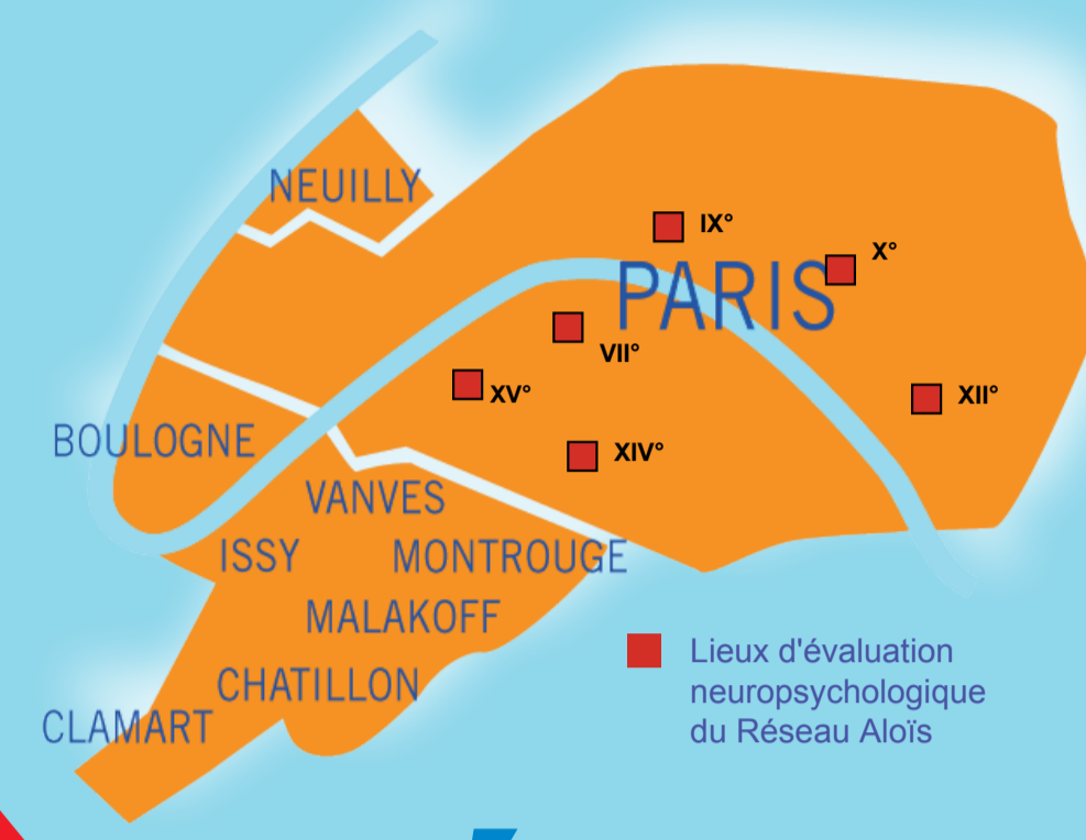
Zones d'intervention du réseau Aloïs

CONSULTATION MÉMOIRE DE VILLE Un diagnostic précoce et rapide